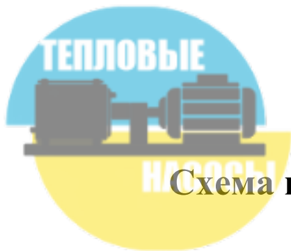
Схема горячего водоснабжения душевой