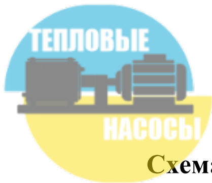
Схема локального отопления здания